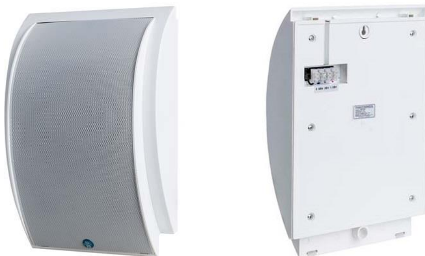
Рис. 1. Внешний вид громкоговорителя.

Внешний вид громкоговорителя показан на рис. 1.